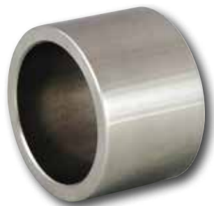
Distanzhülse / Edelstahl Distance bush / stainless steel